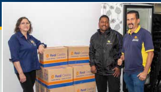
Paróquia Nossa Senhora Imaculada Conceição, no bairro do Montanhão, em São Bernardo do Campo, também recebeu cestas básicas, que serão doadas a famílias em situação de vulnerabilidade