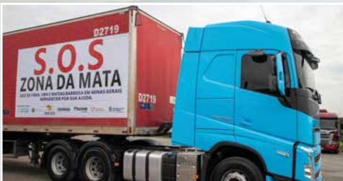
Mobilização do Sinaceg, da Cooperceg e do Sicoob Credceg, em parceria com a Conectando Saúde, resultou no envio de duas carretas para a Zona da Mata de Minas Gerais