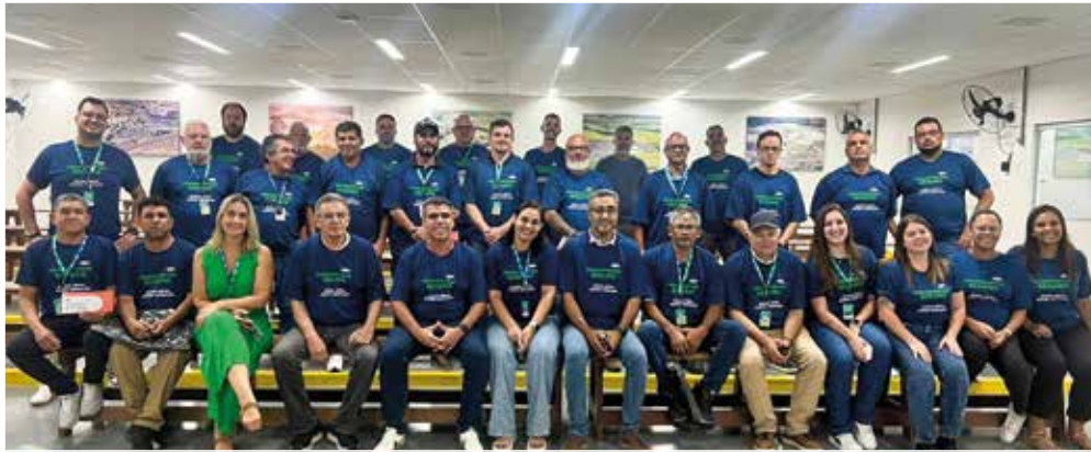
Registro geral do evento de entrega de brindes, realizado em fevereiro

Os primeiros resultados indicam maior conscientização, engajamento e redução de ocorrências, consolidando a segurança como valor compartilhado e ampliando o foco para garantir que todos retornem em segurança ao final de cada jornada.