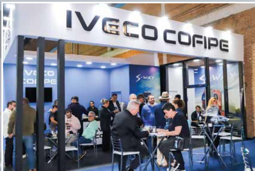
Cofipe, concessionária Iveco, já confirmou presença na Expo 2026