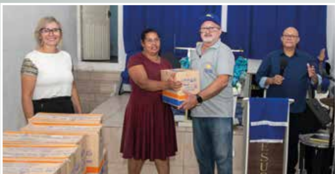
No bairro Batistini, em São Bernardo, as doações foram direcionadas à Igreja Assembleia de Deus