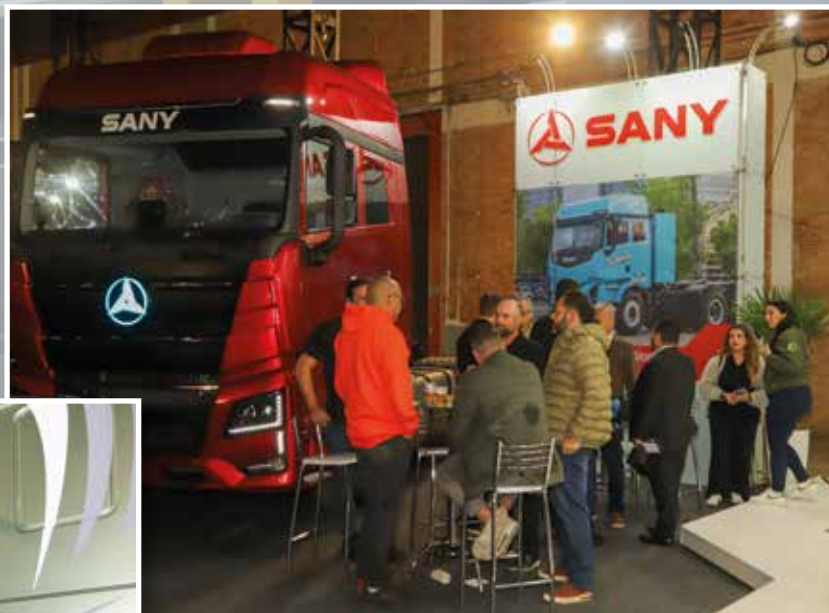
Sany, fabricante chinesa de caminhões, fez sua estreia na Feira dos Cegonheiros em 2025

Durante o evento, os visitantes têm oportunidade de conhecer os lançamentos de perto