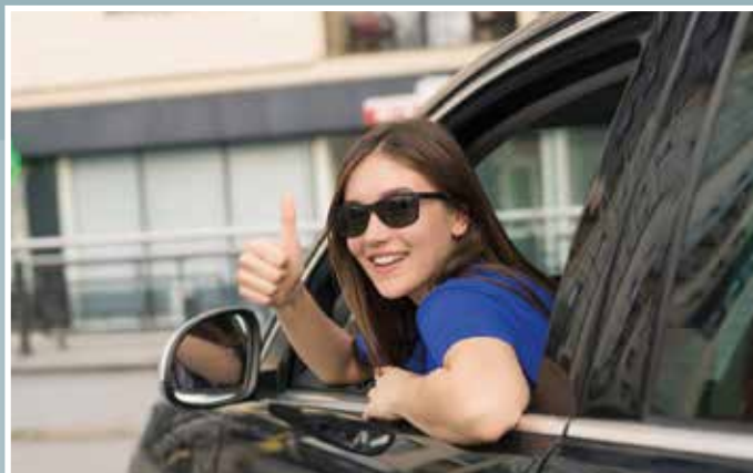
Carro próprio segue no radar da geração Z