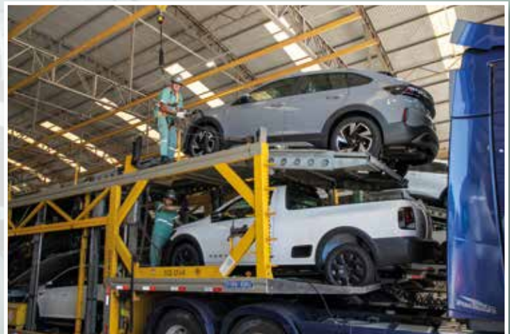
Enquanto um amarrador ajusta e finaliza a amarração do carro de cima, outro termina a do veículo de baixo