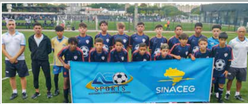
Com apoio logístico do Sinaceg, atletas da AC Sports Escola de Futebol disputaram a Copa Libraef