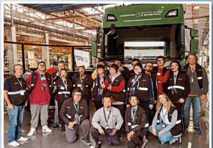
Grupo inclusivo pessoas com TEA (Transtorno do Espectro Autista) da Escola Gap, em visita à Scania