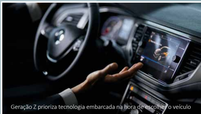
Geração Z prioriza tecnologia embarcada na hora de escolher o veículo

No fim, o que muda não é o interesse pelo carro, mas a forma de chegar até ele. A Geração Z mantém o desejo de ter um veículo próprio, mas transforma a compra em uma decisão calculada, baseada em planejamento, comparação e uso real.