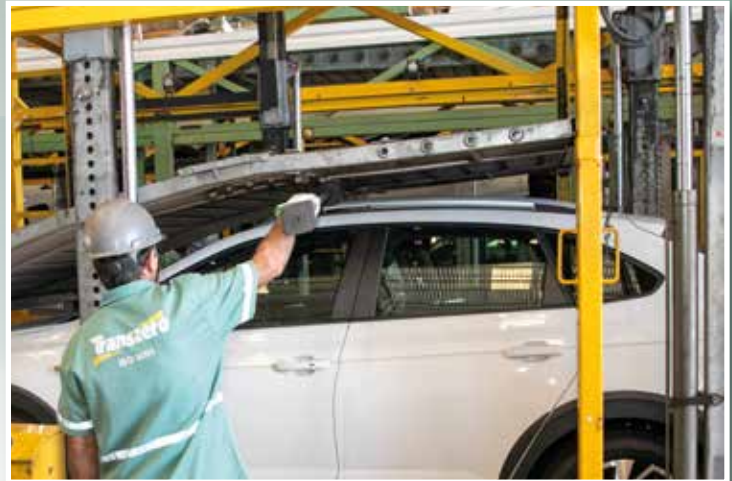
Amarrador usa gabarito de espaço, mais conhecido como cotonete, para conferir a distância entre o carro e a rampa, que deve ser de 10 cm

É esse conjunto de processos, pessoas e decisões que sustenta a operação. E que define, na prática, o que significa ser cegonheiro. É um profissional que não apenas dirige, mas gerencia riscos, coordena etapas e assegura a integridade de uma cadeia logística complexa. É um trabalho técnico, exigente e essencial, que acontece longe dos holofotes, mas sustenta diariamente o funcionamento do setor automotivo no país.