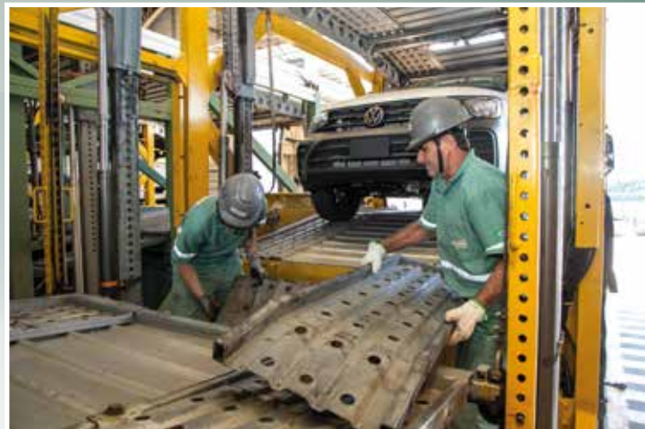
Desmonte das pranchas internas depois de subir o carro

Lógica – O carregamento de uma cegonha está longe de ser uma simples