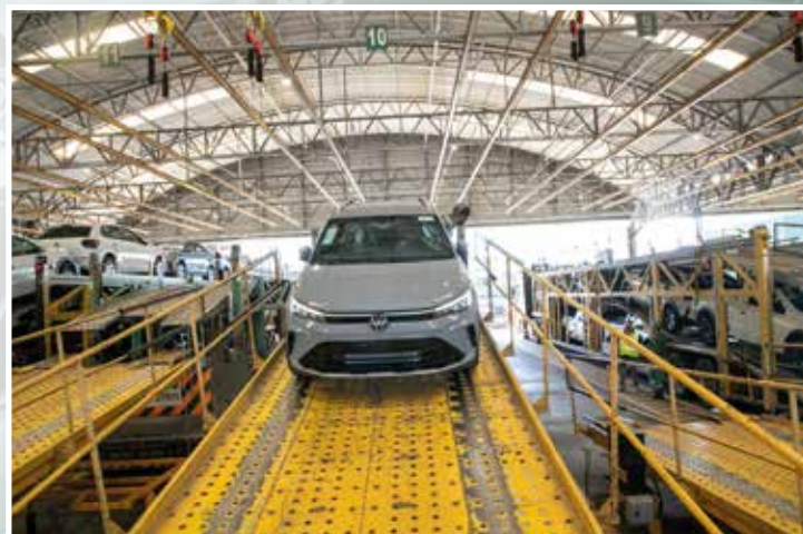
Motorista subidor carregando o veículo