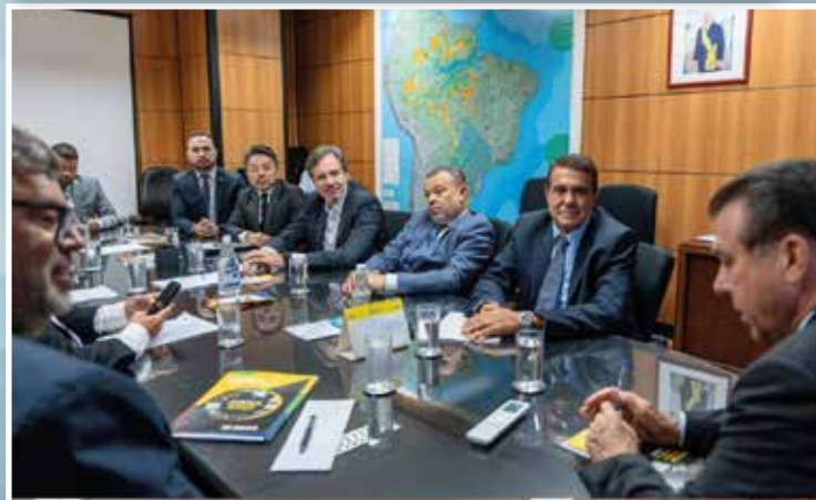
Medidas passam por articulação, diálogo e compartilhamento de responsabilidades