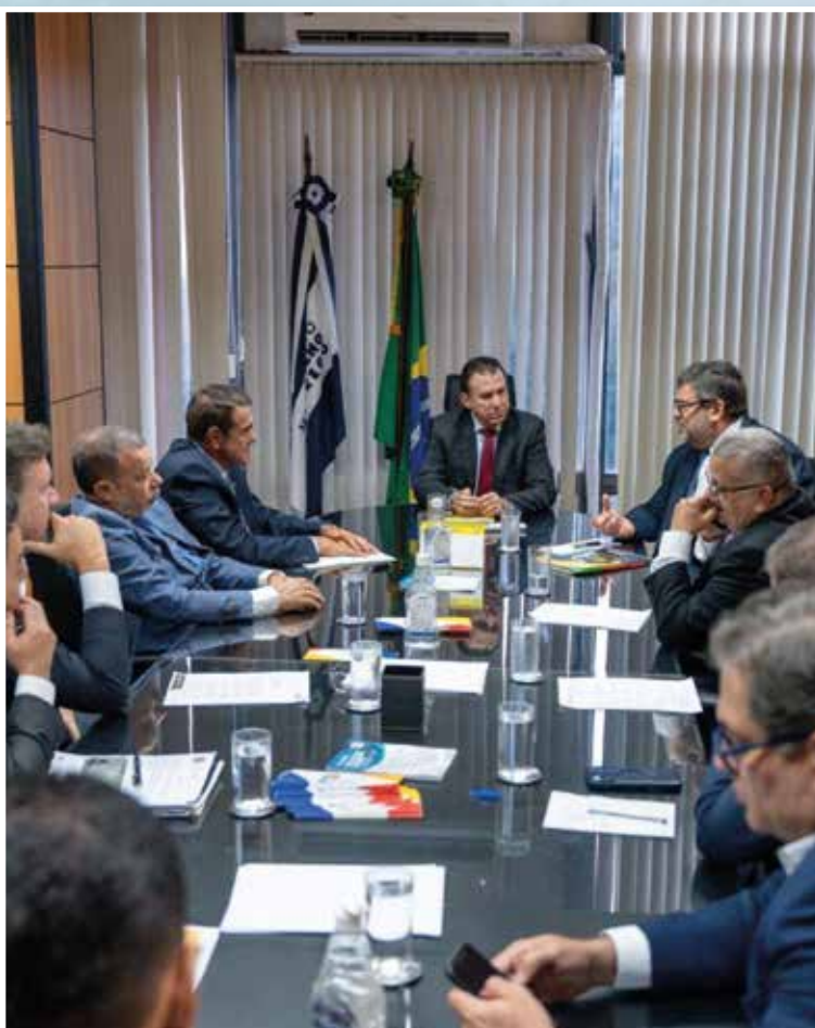
Lideranças do segmento de transporte rodoviário se reúnem com Luiz Marinho, ministro do Trabalho e Emprego, para discutir impacto dos conflitos internacionais no preço do diesel

Estratégia – Diante desse cenário, a atuação do setor tem sido orientada por pragmatismo. No campo institucional, o foco está na interlocução com o governo para reduzir os efeitos das oscilações. Na operação, a orientação é de atenção redobrada. Buscar melhores condições de abastecimento, priorizar fornecedores confiáveis e denunciar abusos são medidas consideradas essenciais para mitigar